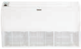
Sivulta puhaltava sisäyksikkö 70-A